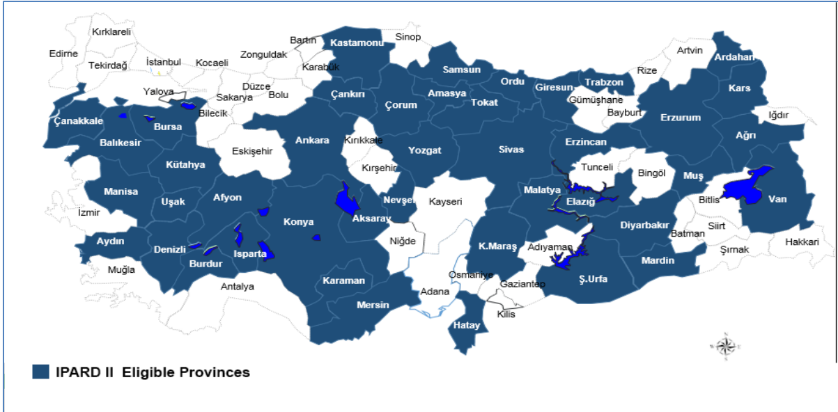
Şekil 1. Programın Başlaması ile Birlikte IPARD 2014-2020'den Yararlanacak Olan İller

2007-2013 programından sorunsuz bir geçiş sağlamak amacıyla 2014-2020 programı ilk başta IBBS Düzey 3 bölgelerine karşılık gelen ve IPARD 2007-2013'ün uygulandığı 42 ili (Afyonkarahisar, Ağrı, Aksaray, Amasya, Ankara, Ardahan, Aydın, Balıkesir, Burdur, Bursa, Çanakkale, Çankırı, Çorum, Denizli, Diyarbakır, Elazığ, Erzincan, Erzurum, Giresun, Hatay, Isparta, Kahramanmaraş, Karaman, Kars, Kastamonu, Konya, Kütahya, Malatya, Manisa, Mardin, Mersin, Muş, Nevşehir, Ordu, Samsun, Sivas, Şanlıurfa, Tokat, Trabzon, Uşak, Van ve Yozgat ) kapsayacaktır. Ulusal Kırsal Kalkınma Stratejisi, IPARD Programı'nın 81 ilin tamamının katılımını öngördüğünden, eldeki bütçe, fon emilim eğilimleri ve maliyet/kâr analizi ile yönetim maliyetleri göz önünde bulundurularak IPARD 2014-2020 program kapsamının tüm illere genişletilmesi gündeme gelebilir. Karar alınırken ayrıca, AB Kırsal Kalkınma deneyiminin tüm ülke genelinde genişletilmesi ile ortaya çıkan katma değer de hesaba katılacaktır.